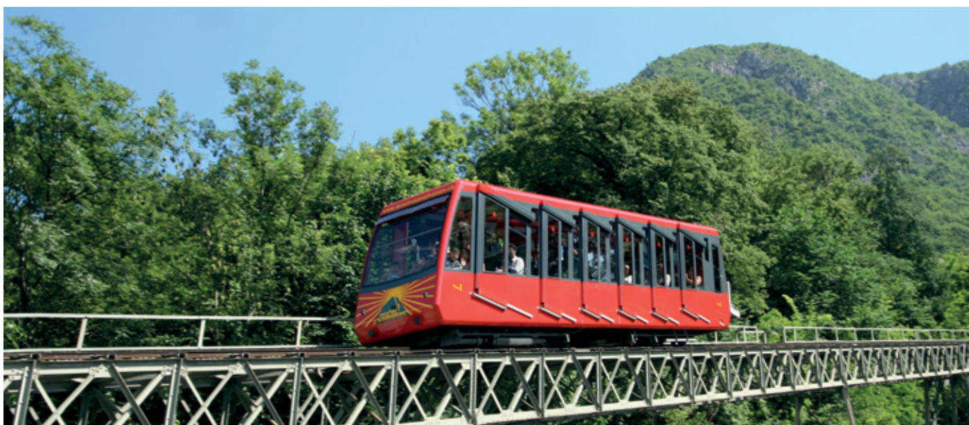
Vettura in servizio dal 2001 al 2023