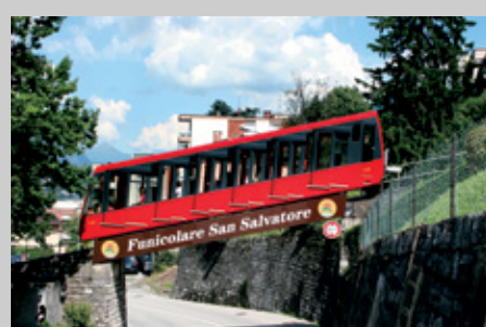
La funicolare in funzione dal 2001 che va in pensione