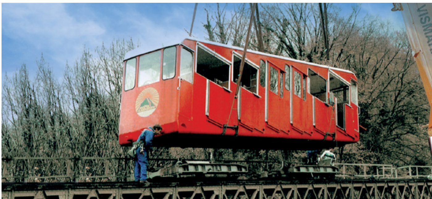
Vettura in esercizio dal 1957 al 2001