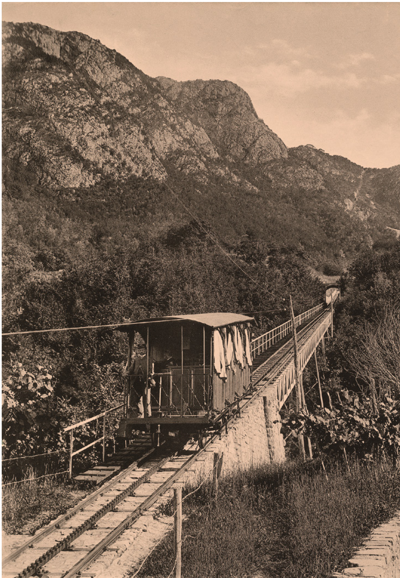
Vettura in esercizio dal 1890 al 1926