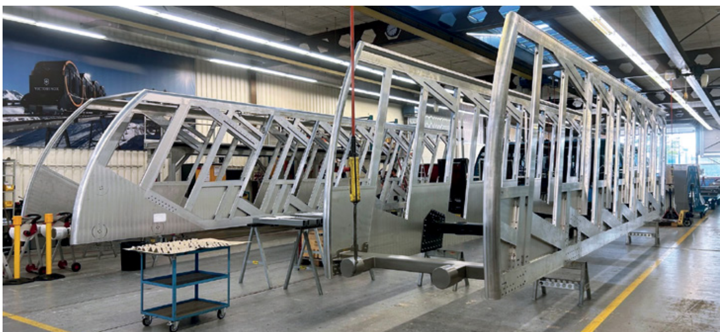
Nuove vetture in costruzione